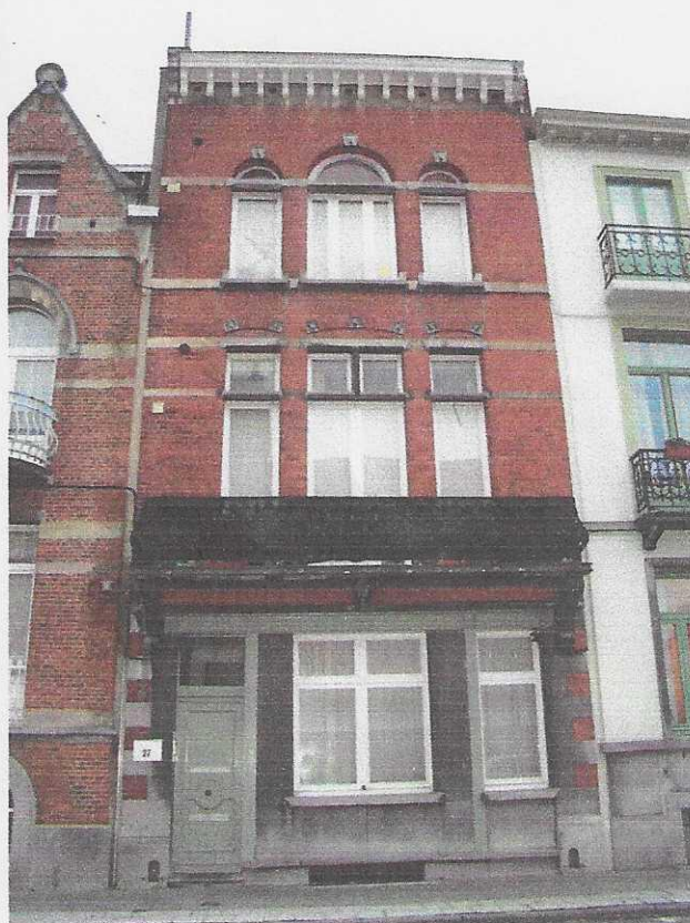
Situation PU 2014