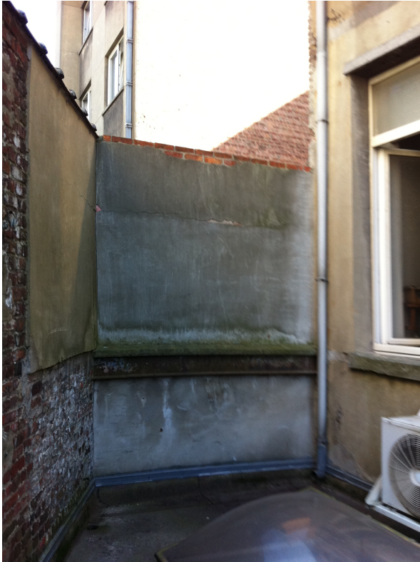
Plateforme 1 er étage – vue vers n°13 Bd Jamar