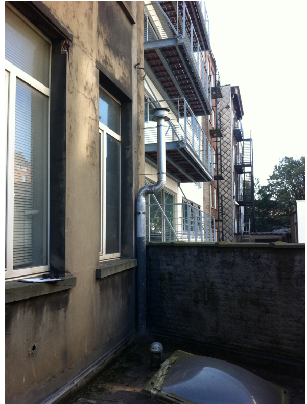
Plateforme 1 er étage – vue vers n°17 Bd Jamar