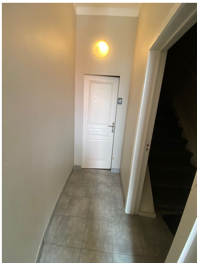
Entrée vers logement