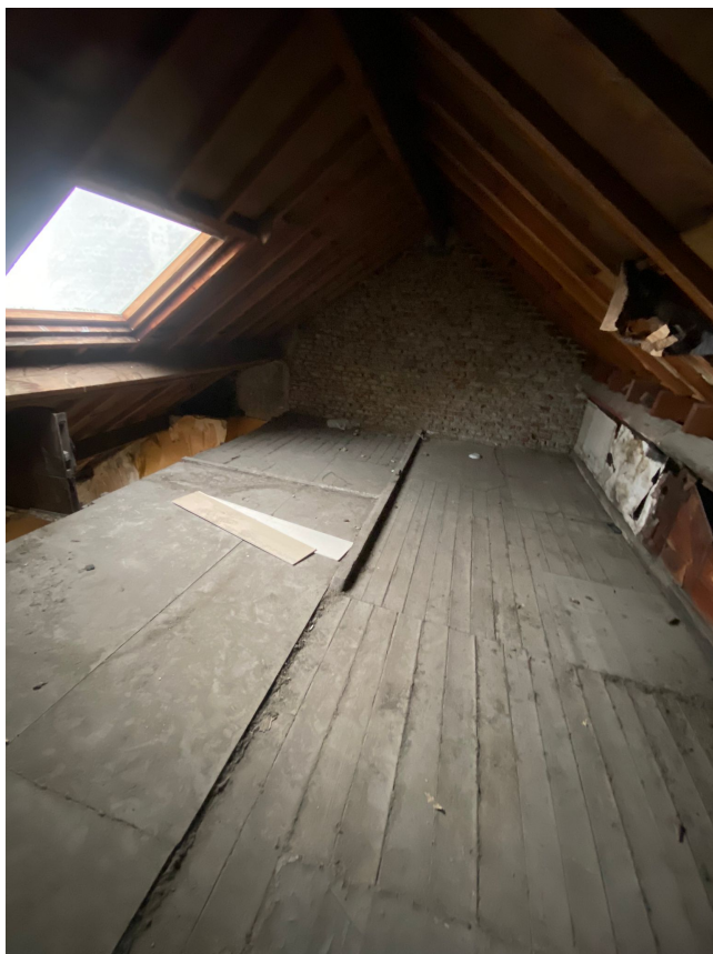
Grenier / mezzanine