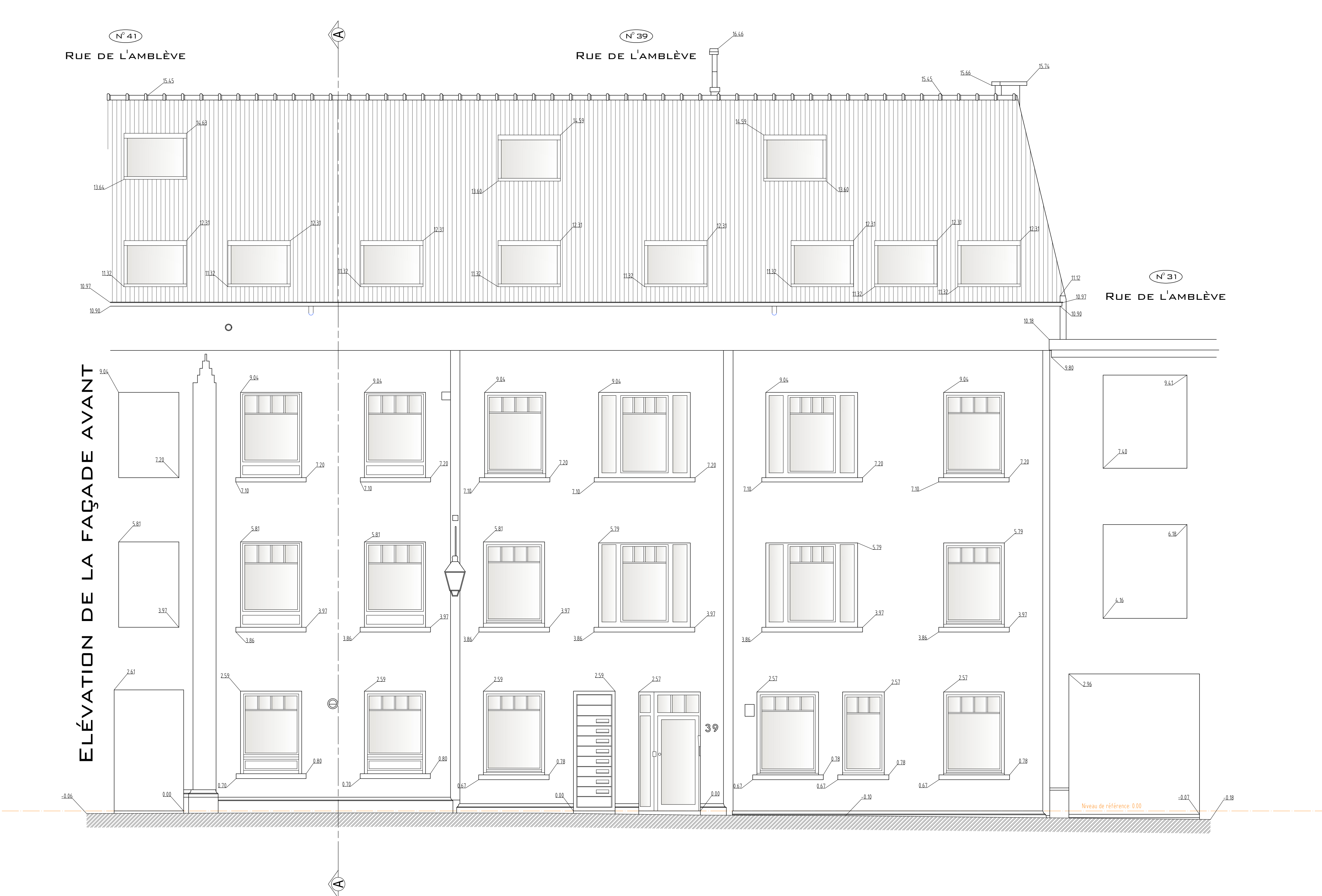
FAÇADE VERS RUE DE L'AMBLÈVE