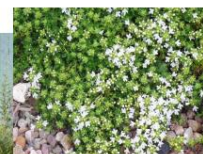
Thymus praecox 'Albiflorus' entre les pierres