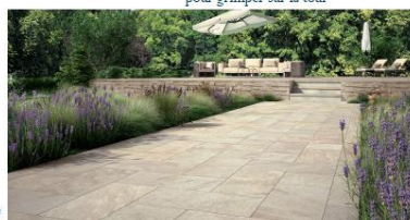
Carrelage en grès cérame imitation pierre de France