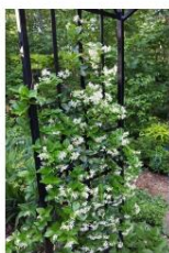
Jasmin étoilé ( Trachelospermum jasminoides ) pour grimper sur la tour