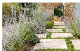
Pierres claires avec joints verdurisés