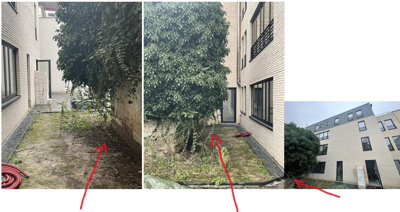
Zone de placement des 3 installations de climatisation (au sol) en façade arrière