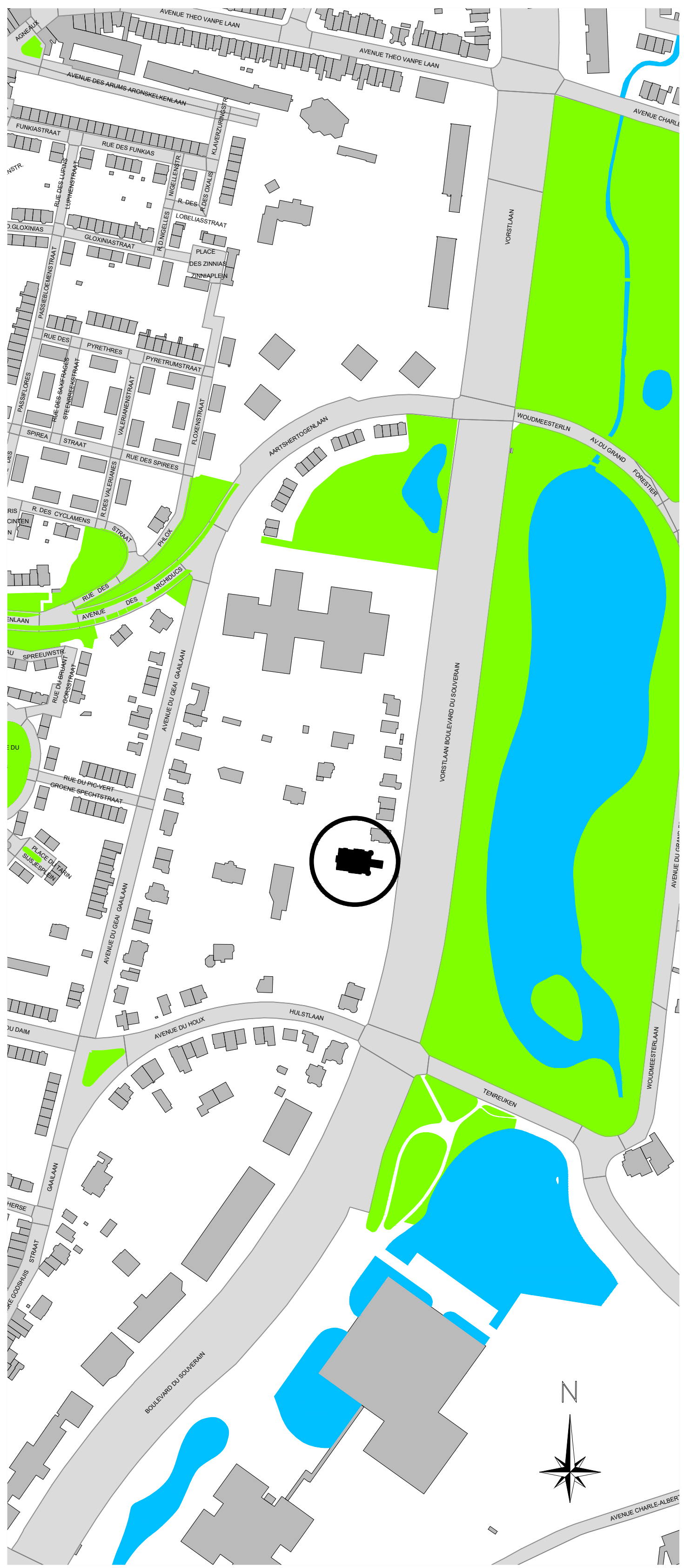
Plan de situation - échelle 1/2500

Situation: Commune // 1170 WATERMAEL-BOISFORT Adresse // Boulevard du Souverain n°86 Cadastré // 1er div., Sect. D n°296s et 296r