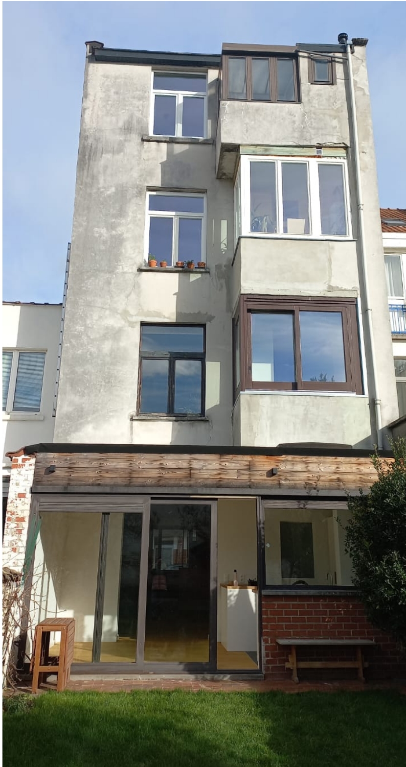
Photo 5 - façade arrière