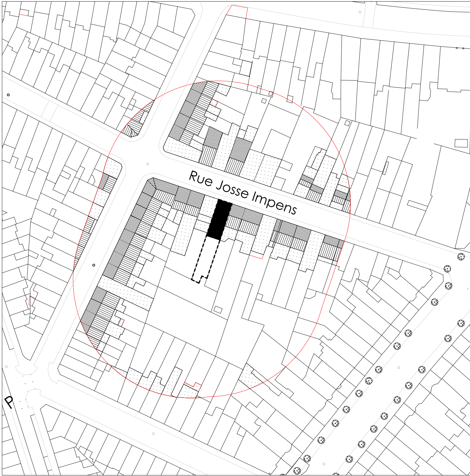
PLAN DE LOCALISATION Echelle 1/1000 ème