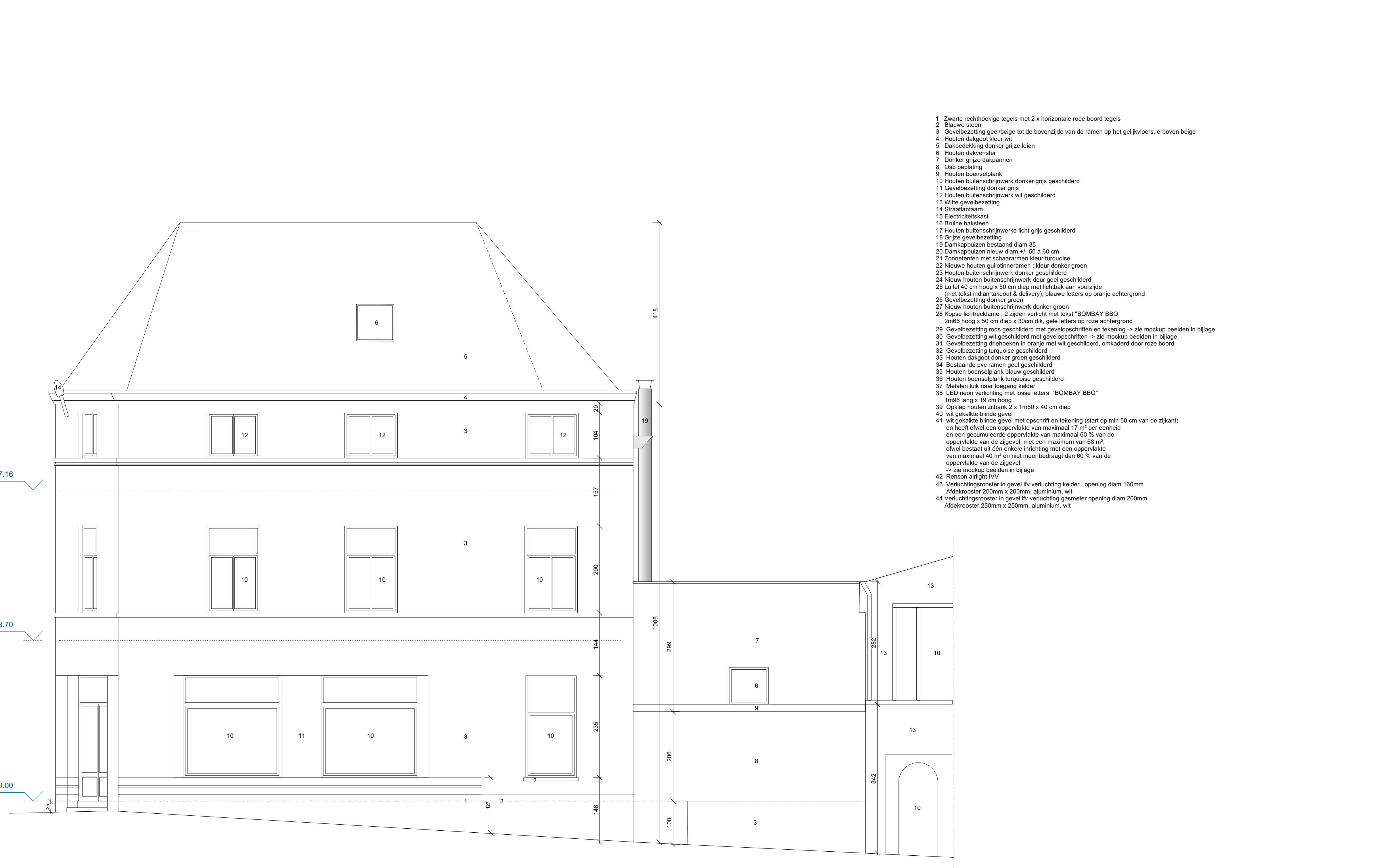
AANZICHT GEVEL ZIJDE ELSENSESTEENWEG BESTAANDE TOESTAND schaal 1/50