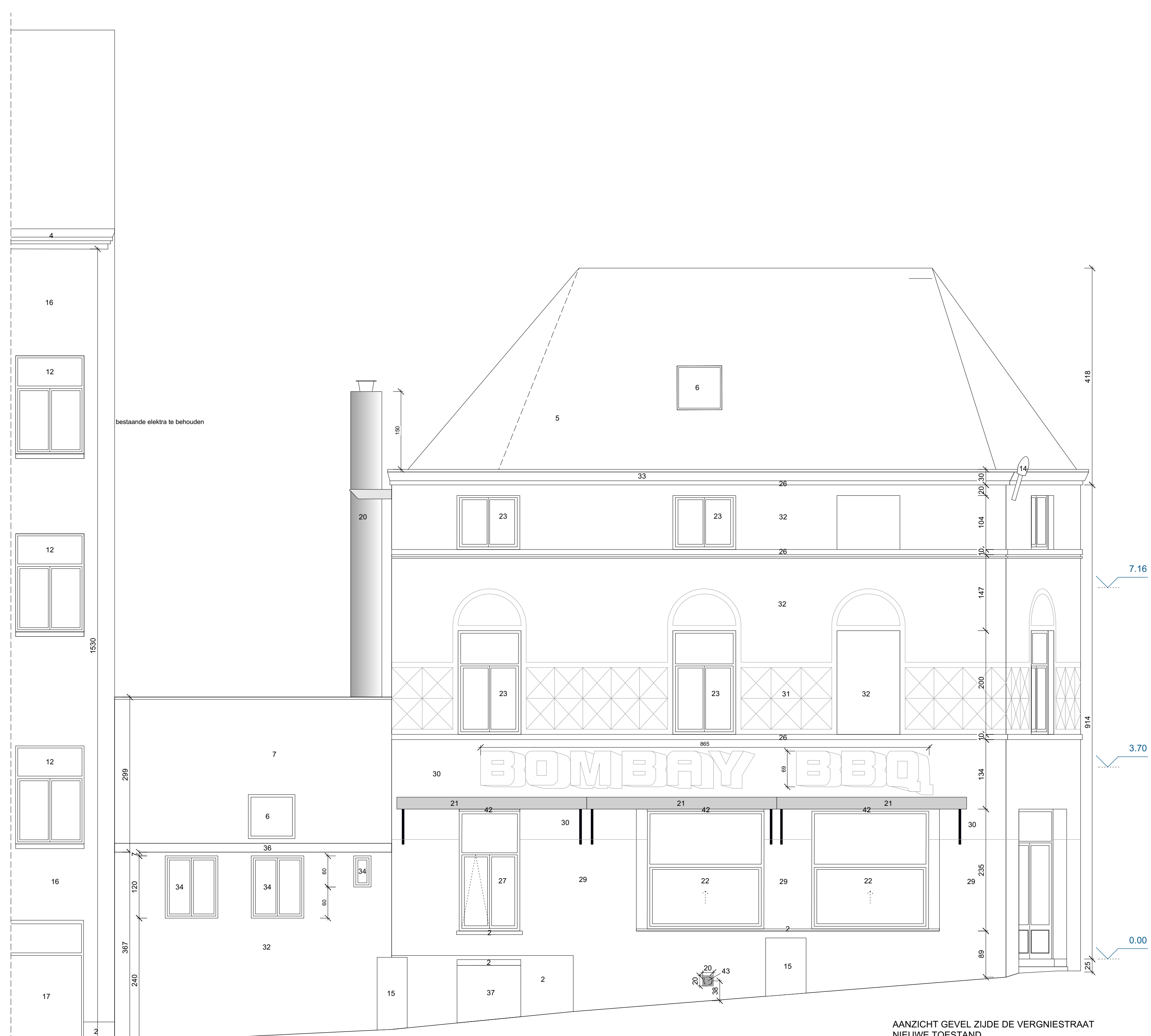
AANZICHT GEVEL ZIJDE DE VERGNIENSTRAAT NIEUWE TOESTAND schaal 1/50