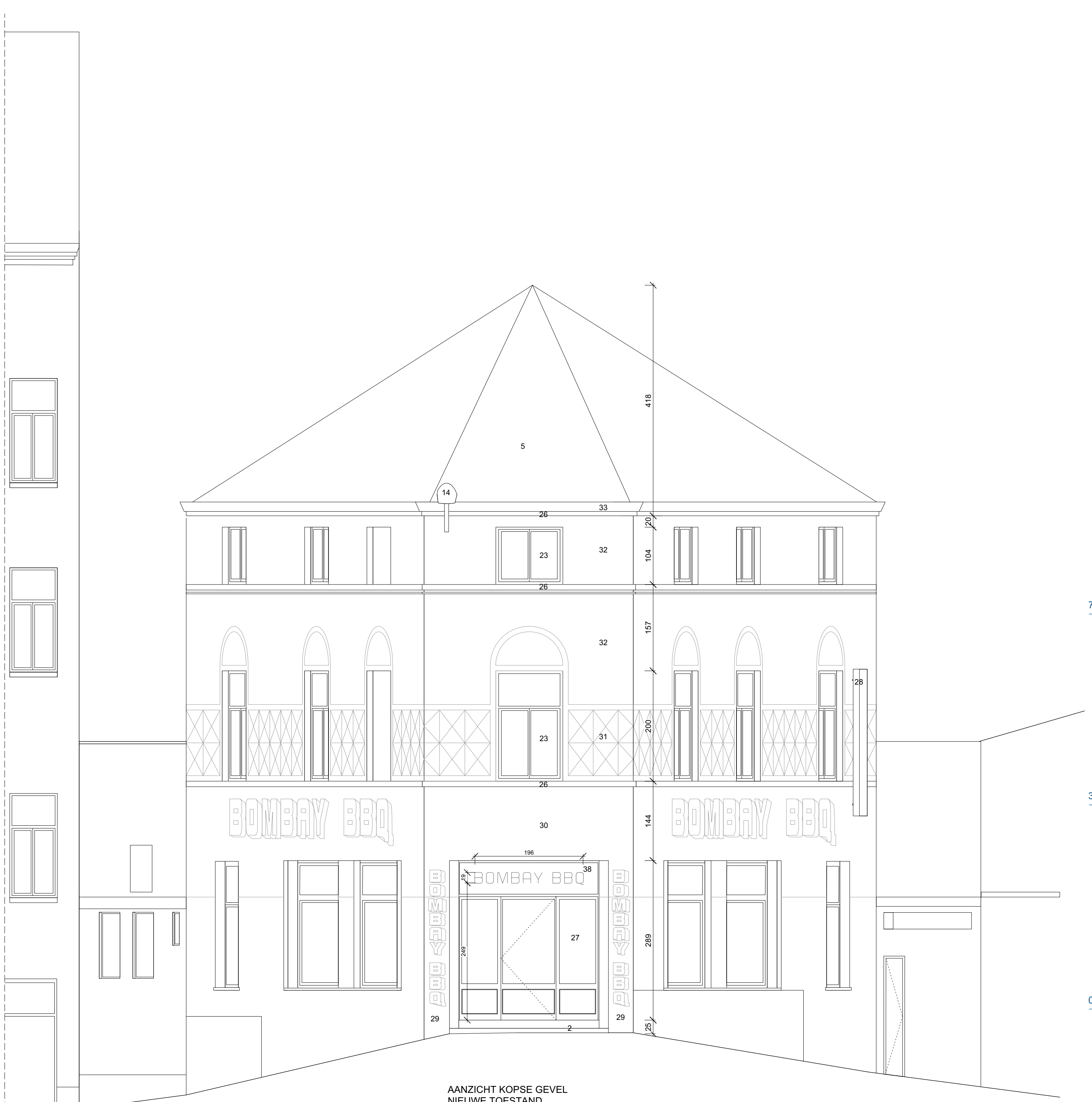
AANZICHT GEVEL KOPSE GEVEL NIEUWE TOESTAND schaal 1/50