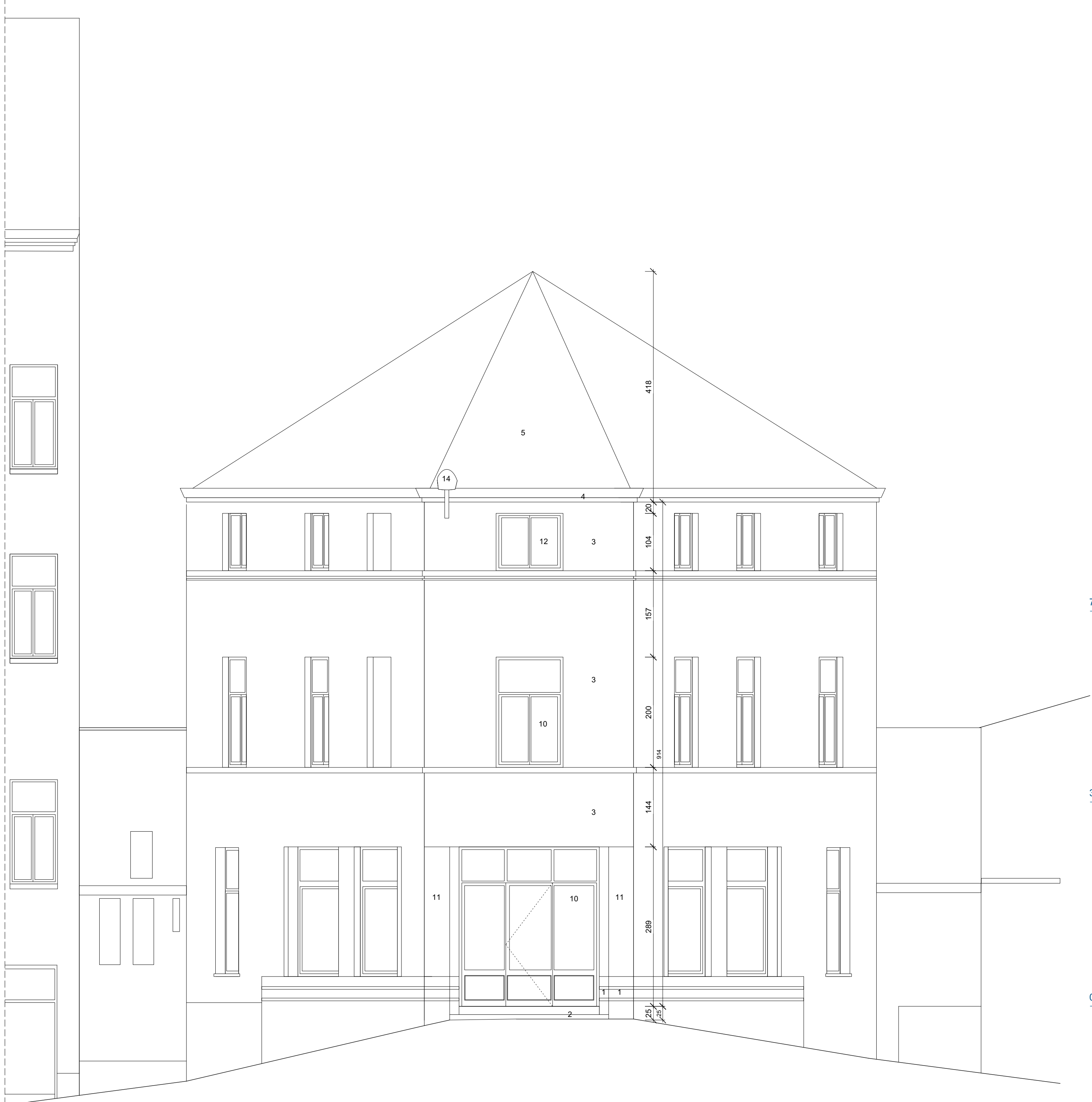
AANZICHT KOPSE GEVEL BESTAANDE TOESTAND schaal 1/50